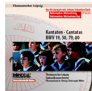
ROP4031 Reformation - Michaelistag Reformation - Michaelmas Day