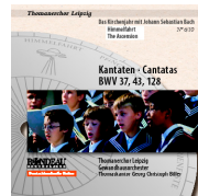
ROP4041 Himmelfahrt The Ascension