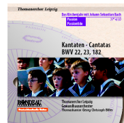
ROP4044 Passion Passiontide