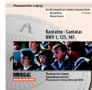
ROP4039 Marienfeste Marian Feasts