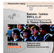
ROP4045 Ostern Easter