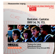
ROP4026 Pfingsten Pentecost