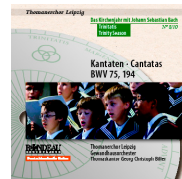
ROP4036 Trinitatis Trinity Season