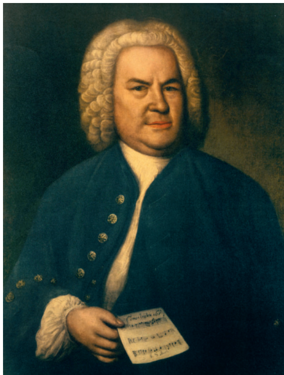
Portrait of Johann Sebastian Bach; made in 1746 by Elias Gottlob Haußmann (1695–1774)