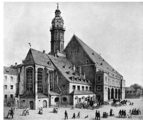
Thomaskirche um 1850 St Thomas's Church, around 1850