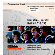
ROP4043 Weihnachten Christmas